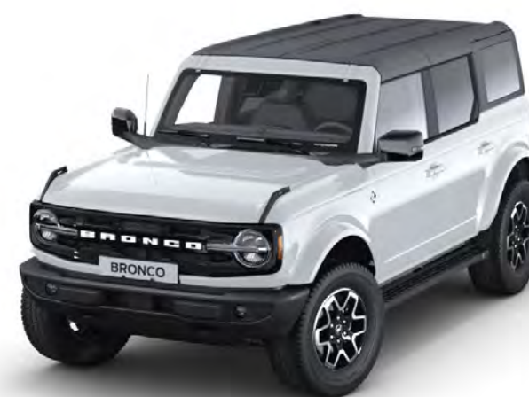
Oxford White Alapfényezés