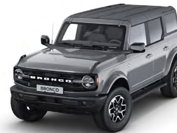
Carbonized Grey Metál karosszériafehérítés*