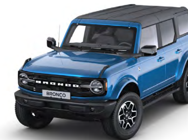
Velocity Blue Metál karosszériafehérítés*