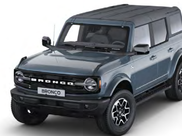
Azure Grey Metál karosszériafehérítés*