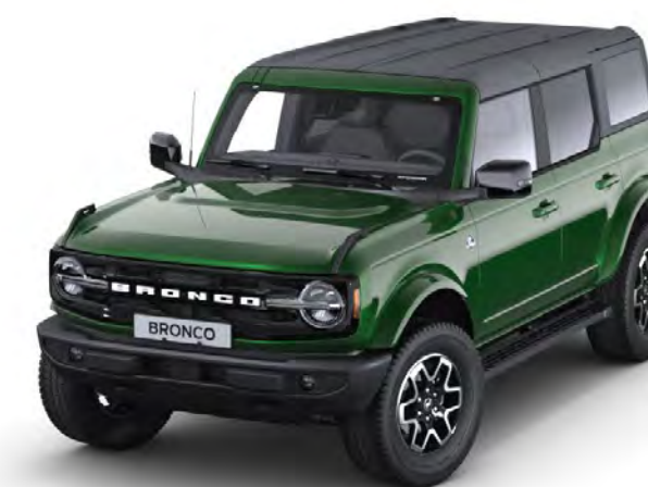
Eruption Green Metál karosszériafehérítés*