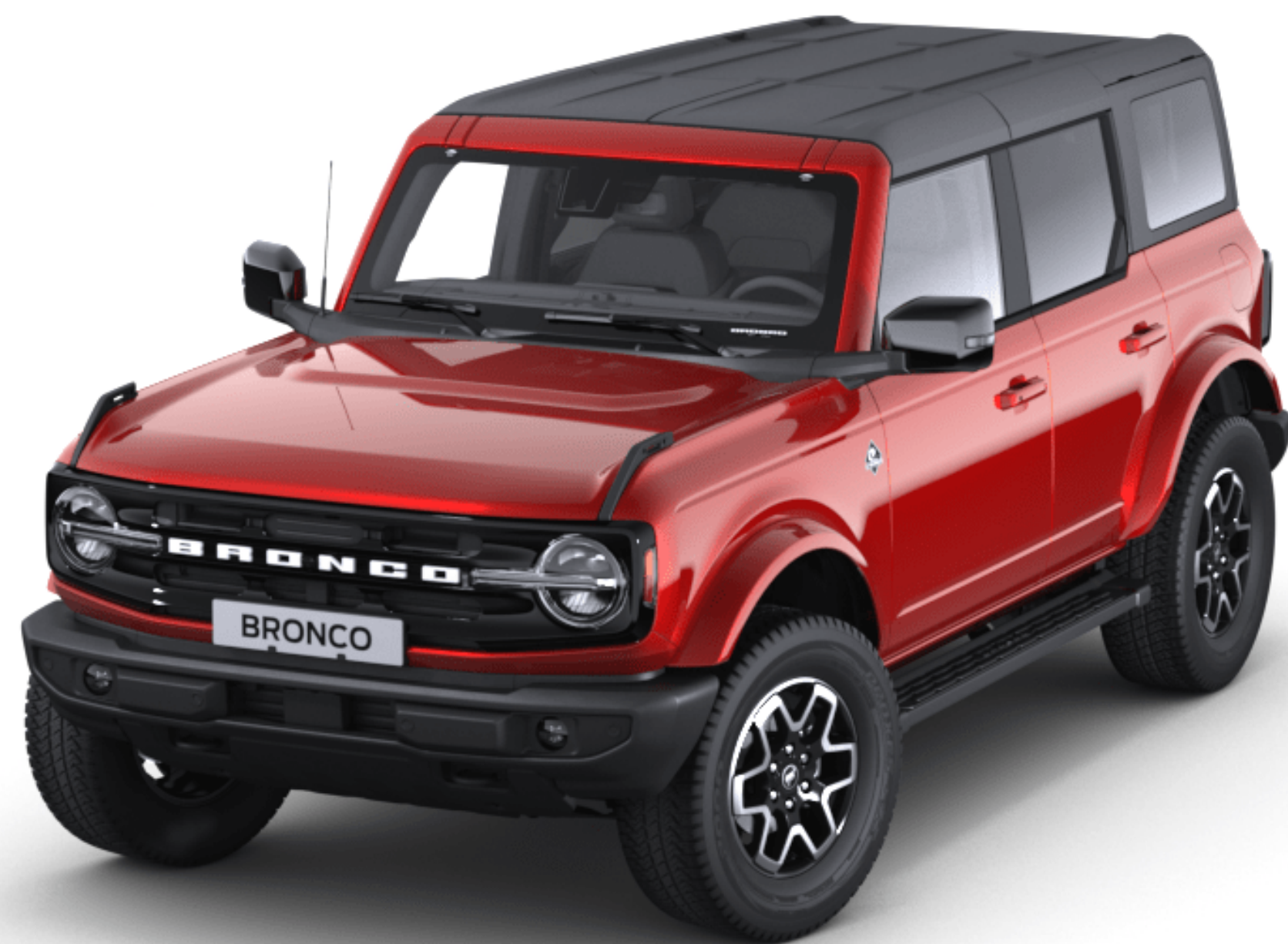
Hot Pepper Red Színezett átlátszó metál karosszériafehérítés*

A Ford Bronco speciális, többlépcsős fényezési eljárásnak köszönheti tartós külsejét. A viaszos üregvédelemmel ellátott acél karosszériaelemek, a fedőlakkréteg nyújtotta védelem és a felhordási eljárások biztosítják, hogy új Bronco járműve még sok évig megőrizze vonzó külsejét.