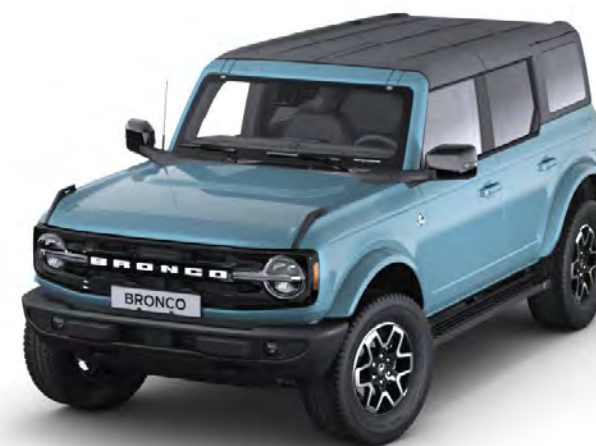
Area 51 Prémium fényezés*