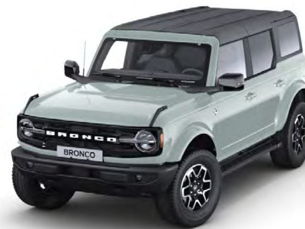
Cactus Grey Prémium fényezés*