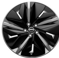
19"-OS KÖNNYŰFÉM KERÉKTÁRCSÁK