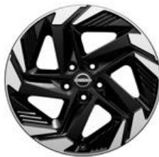
18"-OS KÖNNYŰFÉM KERÉKTÁRCSÁK