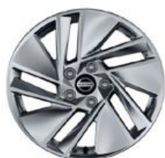
17"-OS KÖNNYŰFÉM KERÉKTÁRCSÁK