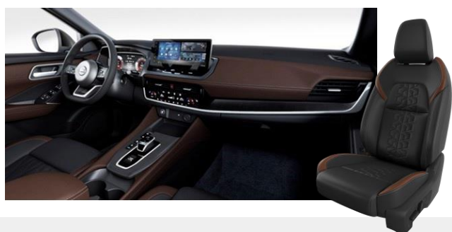
Sötétbarna és fekete szintetikus bőrlélek [H]