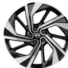
20"-OS KÖNNYŰFÉM KERÉKTÁRCSÁK