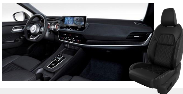
Prémium steppelt bőrlélek és Alcantara betétek [Z]