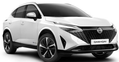
Gyöngyház fehér QBE – 240 000 Ft