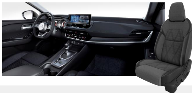
Szövet és szintetikus bőrlélek [G]