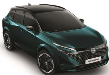
Mély óceán & Fekete YBJ – 500 000 Ft