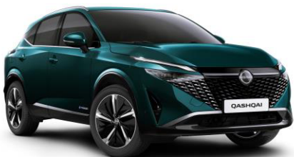
Mélyóceán FAP – 240 000 Ft