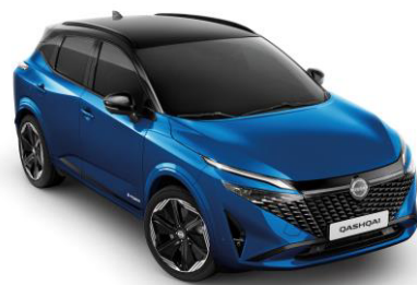
Kék & Fekete XGZ – 500 000 Ft