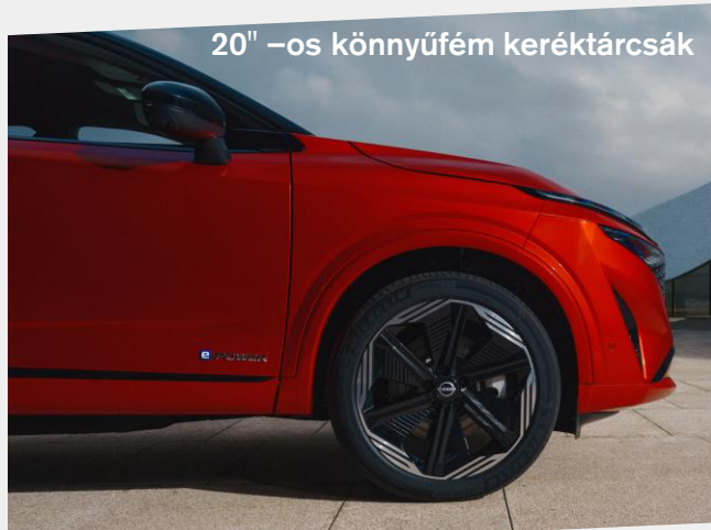
20" –os könnyűfém keréktárcsák