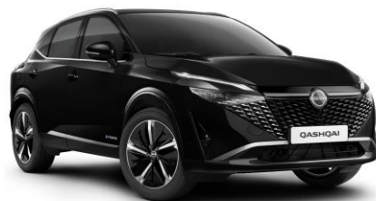
Fekete GAT – 200 000 Ft