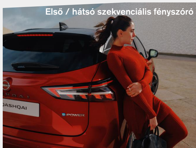
Első / hátsó szekvenciális fényszóró