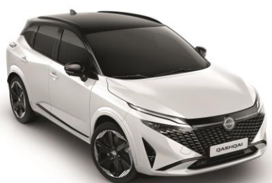
Gyöngyházfehér & Fekete XKJ – 500 000 Ft