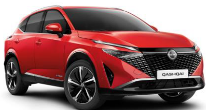
Naplementevörös NBV – 240 000 Ft