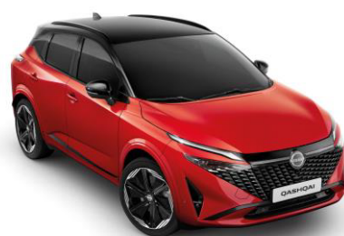
Naplementevörös & Fekete YAU – 500 000 Ft