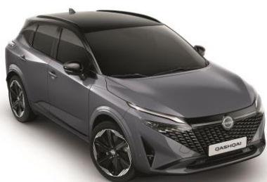
Szürke & Fekete XEX – 500 000 Ft