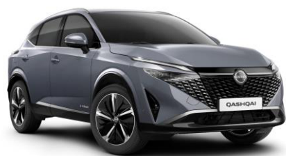
Gyöngyházzsürke KBY – 240 000 Ft