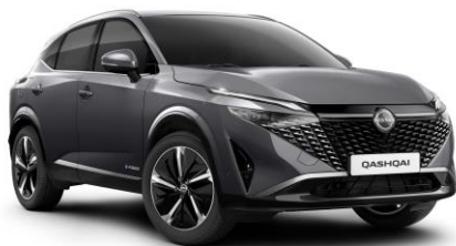
Szürke KAD – 200 000 Ft