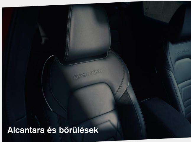
Alcantara és bőrülések