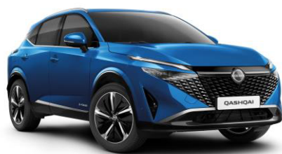
Kék RCF – 240 000 Ft