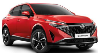
Naplemente vörös NBV – 240 000 Ft