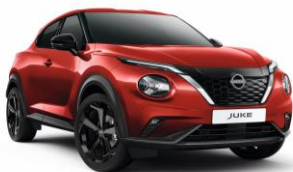
Piros Z10 – 0 Ft