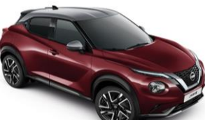
Burgundi / Ezüst XEE – 300 000 Ft