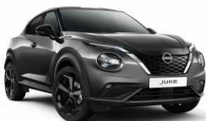
Szürke KAD – 160 000 Ft