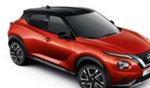
Piros / Fekete YAU – 300 000 Ft