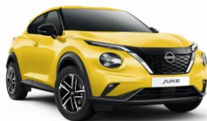
Sárga ECE – 160 000 Ft