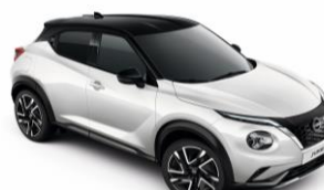
Fehér / Fekete XKJ – 300 000 Ft