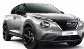
Ezüst KYO – 160 000 Ft