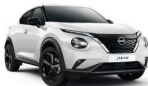
Gyöngyház fehér QBE – 190 000 Ft