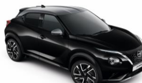
Fekete / Ezüst YAY – 300 000 Ft