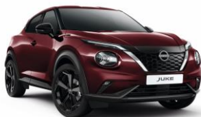
Burgundi NBQ – 160 000 Ft