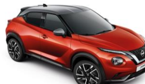
Piros / Ezüst XEZ – 300 000 Ft