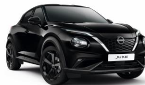
Gyöngyház fekete GAT – 160 000 Ft