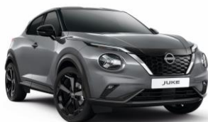
Gyöngyház szürke KBY – 160 000 Ft