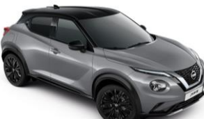
Szürke / Fekete XEX – 300 000 Ft