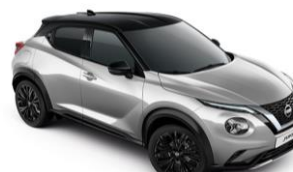
Ezüst / Fekete YAV – 300 000 Ft