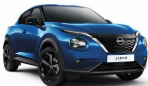
Élénk kék RCF – 160 000 Ft