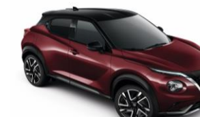
Burgundi / Fekete XDO – 300 000 Ft