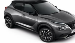
Szürke / Fekete GAQ – 300 000 Ft