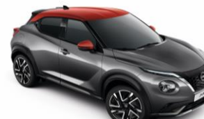
Szürke / Piros XFB – 300 000 Ft