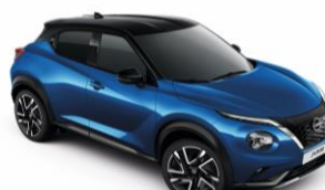
Élénk kék / Fekete XGZ – 300 000 Ft