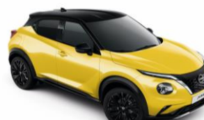
Sárga / Fekete YAS – 300 000 Ft