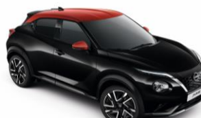
Fekete / Piros YAX – 300 000 Ft