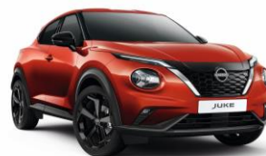
Naplemente vörös NBV – 160 000 Ft