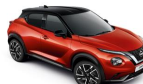
Piros / Fekete YAU – 300 000 Ft