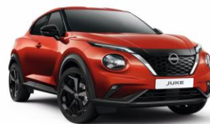
Naplemente vörös NBV – 160 000 Ft