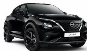
Gyöngyházfekete GAT – 160 000 Ft