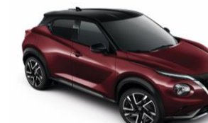
Burgundi / Fekete XDO – 300 000 Ft