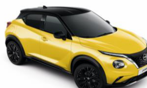
Sárga / Fekete YAS – 300 000 Ft