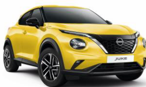
Sárga ECE – 160 000 Ft