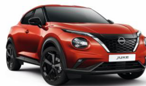
Naplemente vörös NBV – 160 000 Ft