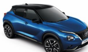
Élénkkek / Fekete XGZ – 300 000 Ft