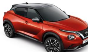
Piros / Ezüst XEZ – 300 000 Ft