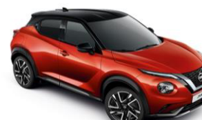
Piros / Fekete YAU – 300 000 Ft