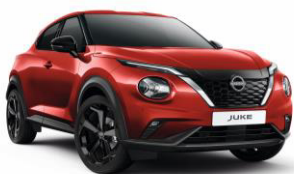
Piros Z10 – 0 Ft