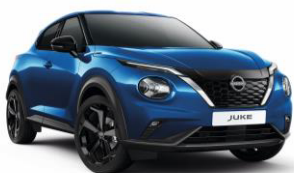
Élénkkek RCF – 160 000 Ft