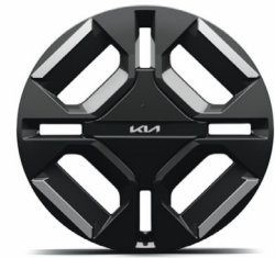
19" keréktárcsa (XP)