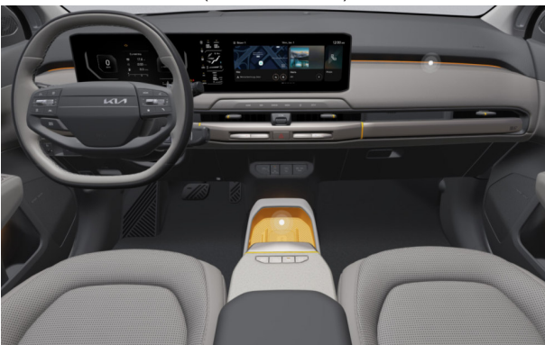
EARTH PLUS - opciós világos szürke 2tone vegán bőr üléskárpit - (Orange díszbetéttel) EWR