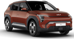
Terra Cotta (TCT)