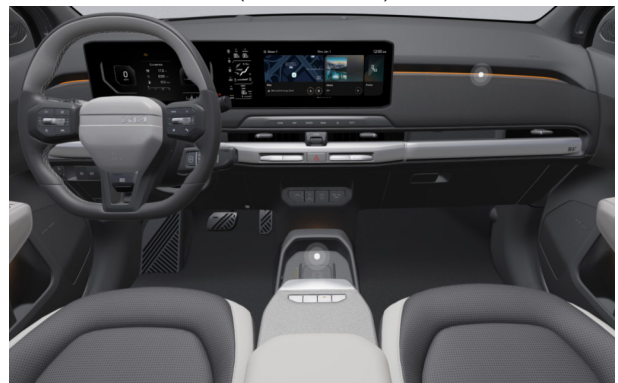
GT-LINE - sztenderd törtfehér-szürke vegán bőr üléskárpit - DFS