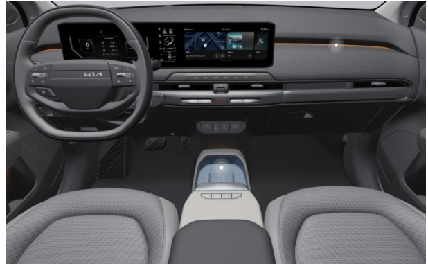
EARTH PLUS - sztenderd szürke 2tone vegán bőr üléskárpit - ELG (Blue díszbetéttel)