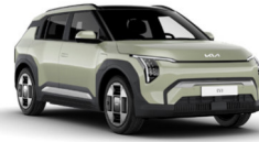
Aventurine Green (AG3)