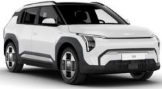
Clear White (UD) alapfényezés