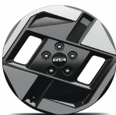
17" keréktárcsa (VA)