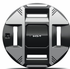
19" keréktárcsa (XM)