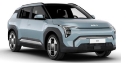
Frost Blue (EBB)