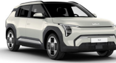
Ivory Silver (ISG)