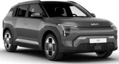
Shale Grey (EBD)