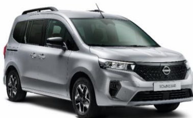
Gyöngyház szürke KQA – 130.000 Ft