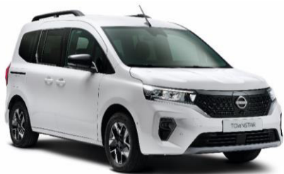
Fehér QNG – 0 Ft