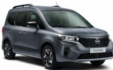
Szürke KPW – 70.000 Ft