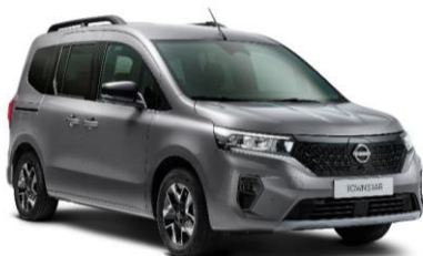
Casiopee Szürke KNG – 130.000 Ft