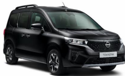
Enigma fekete GNE – 130.000 Ft