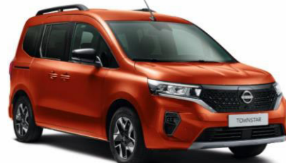
Terrakotta CNZ – 130.000 Ft