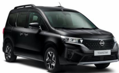
Enigma fekete GNE – 165.100 Ft