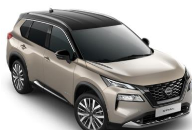
Pezsgő ezüst - Fekete XEW - 450 000 Ft