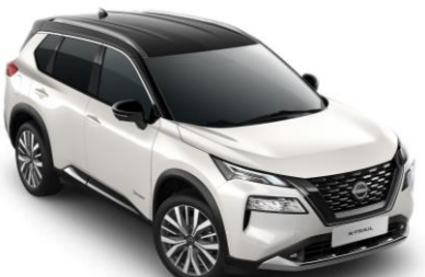
Gyöngyház fehér - Fekete XKJ - 450 000 Ft