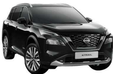
Fekete G41 - 210 000 Ft