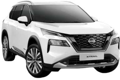
Alap fehér QAK