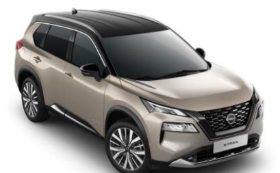
Pezsgőezüst - Fekete XEW - 450 000 Ft