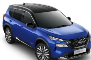
Kék - Fekete XEU - 410 000 Ft