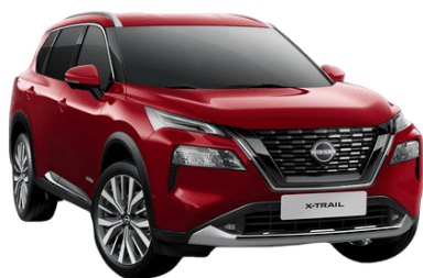
Sötétvörös NBL – 250 000 Ft