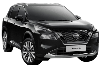
Fekete G41 – 210 000 Ft