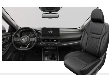
FEKETE NAPPABŐR ÜLÉSEK [G]