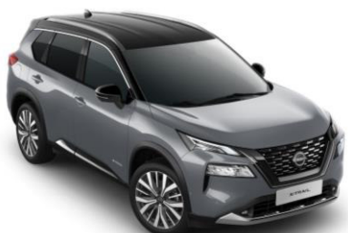
Gyöngyházzsürke - Fekete XEX – 450 000 Ft