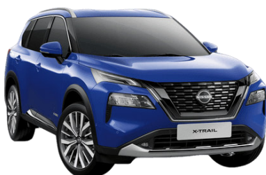
Kék RBV – 210 000 Ft