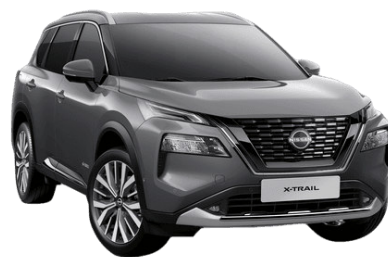
Szürke KAD – 210 000 Ft