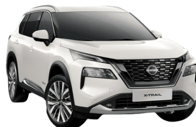
Gyöngyházfehér QBE – 250 000 Ft