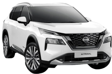
Alap fehér QAK