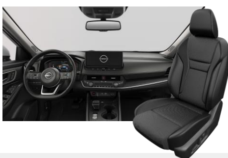
FEKETE SZÖVET ÉS SZINTETIKUS BŐRÜLÉSEK [G]