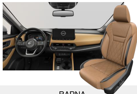
BARNA NAPPABŐR ÜLÉSEK [C]