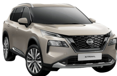
Pezsgő ezüst KAY – 250 000 Ft