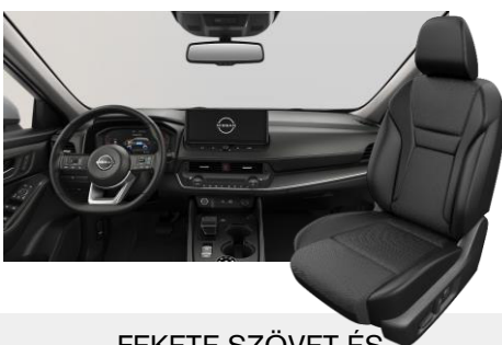
FEKETE SZÖVET ÉS SZINTETIKUS BŐRÜLÉSEK [G]