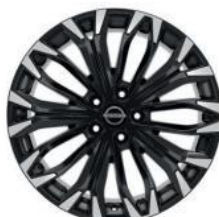
19"-OS KÖNNYŰFÉM KERÉKTÁRCSÁK