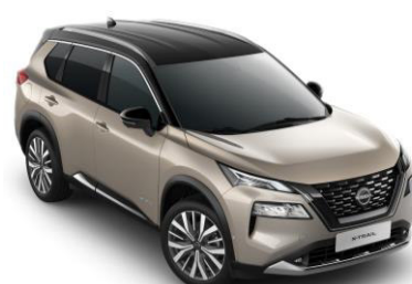
Pezsgő ezüst - Fekete XEW – 450 000 Ft