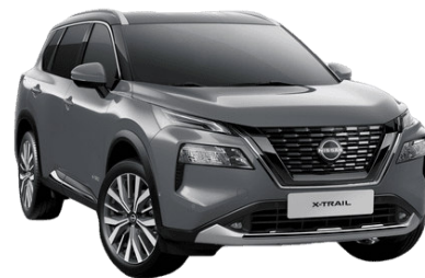
Gyöngyházzsürke KBY – 250 000 Ft