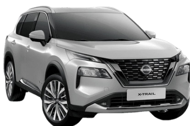
Ezüst K23 – 210 000 Ft