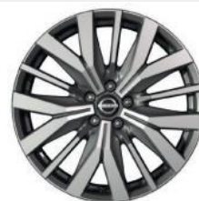
20"-OS KÖNNYŰFÉM KERÉKTÁRCSÁK (Opció)