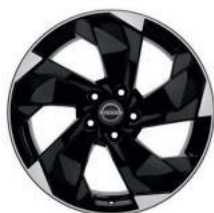
18"-OS KÖNNYŰFÉM KERÉKTÁRCSÁK