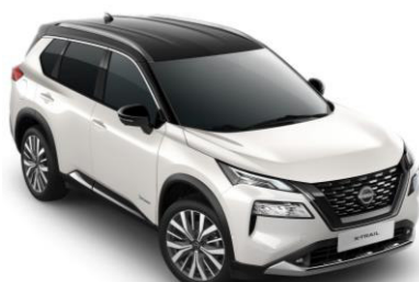
Gyöngyházfehér - Fekete XKJ – 450 000 Ft