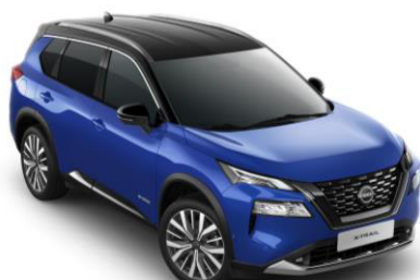
Kék - Fekete XEU – 410 000 Ft