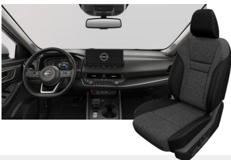
FEKETE SZÖVET ÜLÉSEK [G]