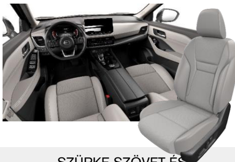
SZÜRKE SZÖVET ÉS SZINTETIKUS BŐRÜLÉSEK [K]