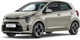
Milky Beige (M9Y) Prémium Metál