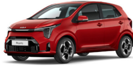
Signal Red (BEG) Prémium Metál