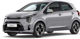
Sparkling Silver (KCS) Metál