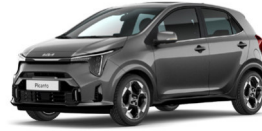
Astro Grey (M7G) Metál