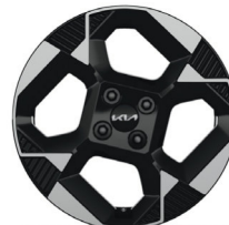
PLATINUM 16" könnyűfém keréktárcsa