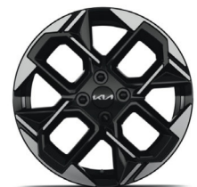
GT LINE 16" könnyűfém keréktárcsa