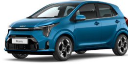
Sporty Blue (SPB) Prémium Metál