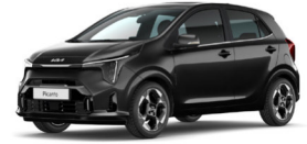
Aurora Black Pearl (ABP) Metál