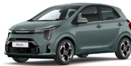
Adventurous Green (A2G) Prémium Metál