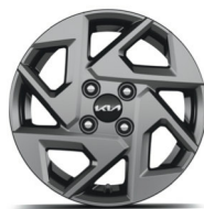
GOLD PLUS (opciós) 14" könnyűfém keréktárcsa