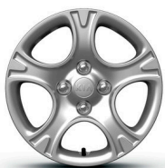
GOLD 14" acél keréktárcsa díszláccsal