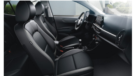
GT LINE sztenderd fekete szintetikus bőr kárpit