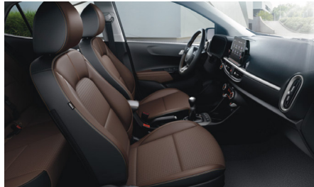
BROWN opciós (PLATINUM felszereléshez) szintetikus bőr kárpit