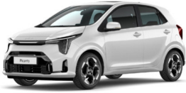
Clear White (UD)