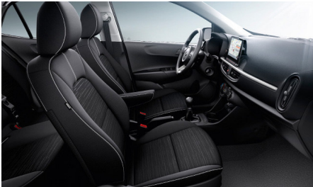
GOLD / PLATINUM sztenderd fekete szövet kárpit