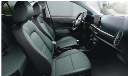
ADVENTUROUS GREEN opciós (GT-LINE felszereléshez) szintetikus bőr kárpit