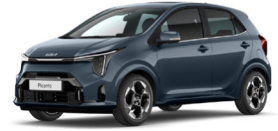
Smoke Blue (EU3) Prémium Metál