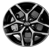
Könnnyűfém keréktárcsa 17" PLATINUM