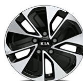
Könnnyűfém keréktárcsa 16" GOLD PLUS csomaghoz