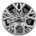
Könnnyűfém keréktárcsa 16" GOLD