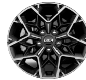
Könnnyűfém keréktárcsa 17" PLATINUM GT LINE GOLD SPORT