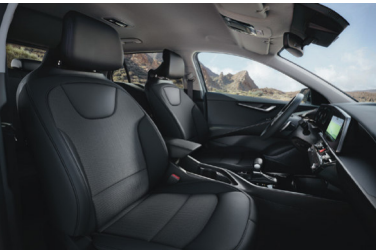
SILVER fekete szövet kárpit (sztenderd)