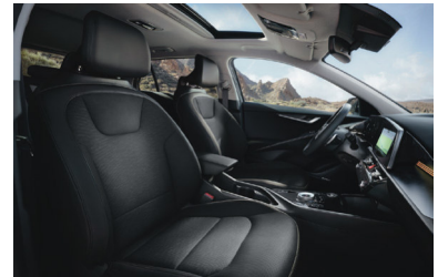
KRYPTONITE fekete szintetikus bőr kárpit (sztfender választható)