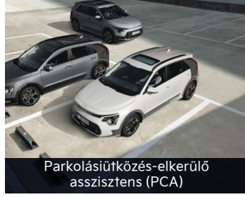
Parkolásiútközés-elkerülő asszisztens (PCA)