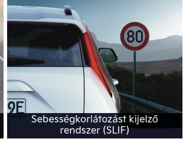
Sebességkorlátozást kijelző rendszer (SLIF)