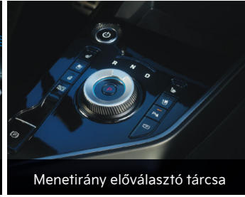
Menetirány előválasztó tárcsa