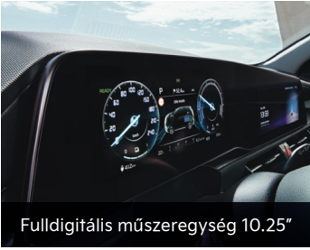
Fulldigitális műszeregység 10.25"