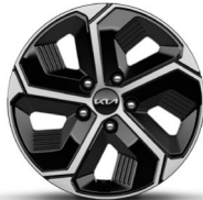
16" alumínium keréktárcsa