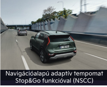
Navigációalapú adaptív tempomat Stop&Go funkcióval (NSCC)