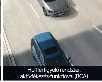
Holttérfigyelő rendszer, aktívfékezés-funkcióval (BCA)