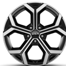
18" alumínium keréktárcsa