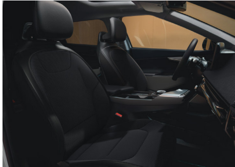
AIR Szövet / Vegánbőr ülésárpít (Bazaltfekete - WK)