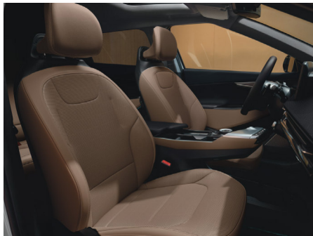
EARTH Vegánbőr ülésárpít (Lattebarna - CRJ)