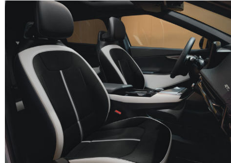
GT-LINE Suede / Vegánbőr ülésárpít (Bazaltfekete / Törtszürke - WK)