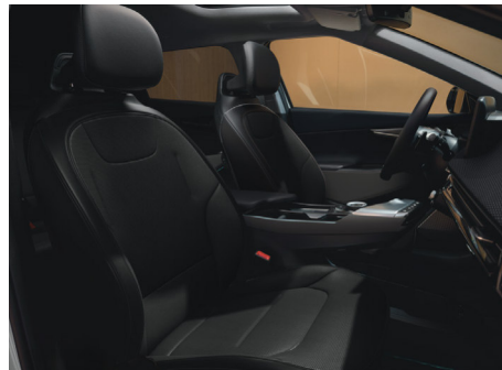
EARTH Vegánbőr ülésárpít (Bazaltfekete - WK)