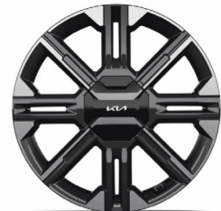
GT-LINE 20" keréktárcsa (VE)