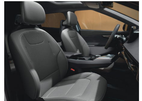
EARTH Vegánbőr ülésárpít (Törtszürke - DFS)