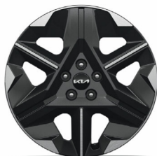
AIR / EARTH 19" keréktárcsa (XM)