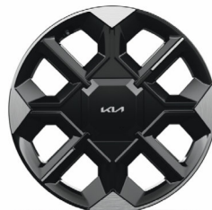
EARTH 20" keréktárcsa (UJ) opció