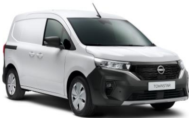
Fehér QNG – 0 Ft