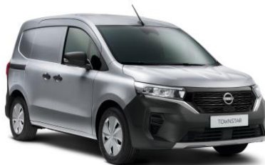
Gyöngyház szürke KQA – 130.000 Ft