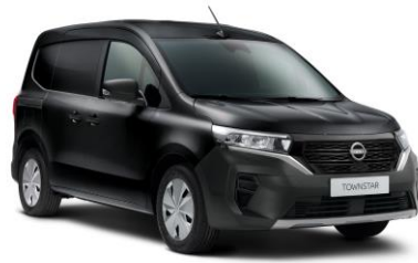
Enigma fekete GNE – 130.000 Ft