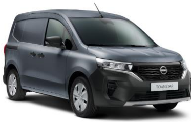
Szürke KPW – 70.000 Ft