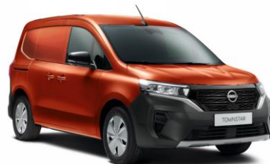
Terrakotta CNZ – 130.000 Ft