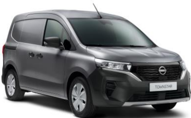
Casiopee Szürke KNG – 130.000 Ft