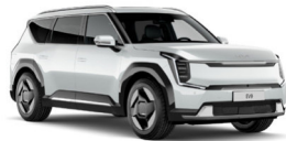
Snow White Pearl (SWP) Prémium Metál