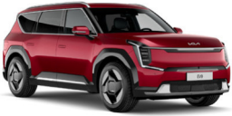
Flare Red (C7R) alapfényezés