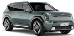
Iceberg Metal (IEG) Metál