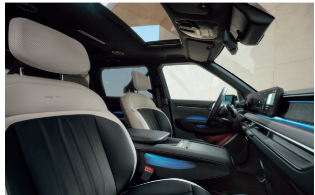
LAUNCH GT-LINE Törtfehér - Fekete (RBQ)