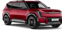
Flare Red (C7R) alapfényezés