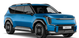
Ocean Blue (OBG) Prémium metál