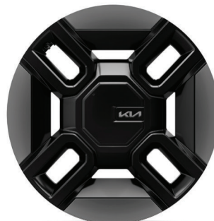
LAUNCH GT-LINE 21" keréktárcsa