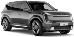
Pebble Gray (DFG) Metál