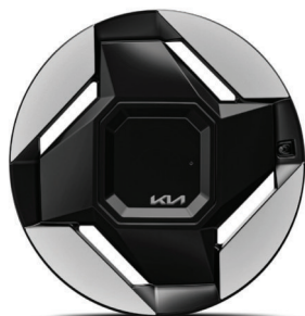
LAUNCH EARTH 19" keréktárcsa