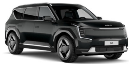
Aurora Black Pearl (ABP) Metál