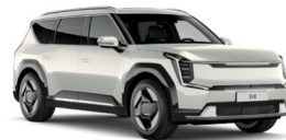
Ivory Silver (ISG) Prémium Metál