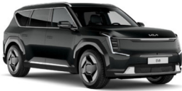
Aurora Black Pearl (ABP) Metál