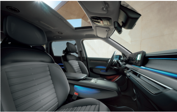
LAUNCH EARTH Fekete - Grafit (RBQ)