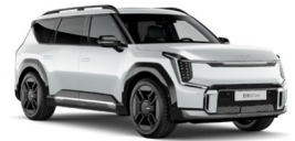
Snow White Pearl (SWP) Prémium Metál