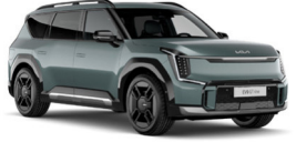
Iceberg Metal (IEG) Metál