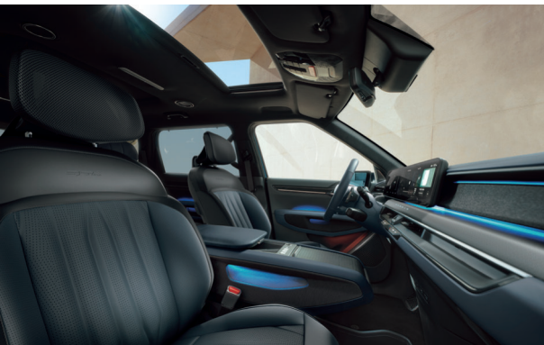
LAUNCH GT-LINE Grafit - Tengeréskék (NJR)