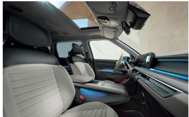
LAUNCH EARTH Grafit - Szignálszürke (EMA)