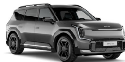
Pebble Gray (DFG) Metál